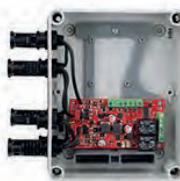
Solar Sentry 2 stringes (2x500V)

Ajánljuk: sziget üzemű rendszerekhez, adótoronyokhoz, nyaralókhoz, kb. 10-12 PV solar panel / string méretű rendszerekhez