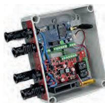
Solar Sentry GSM 2 stringes (2x500V)

a relés és open collectoros kimeneteknek köszönhetően kaphatunk (5 féle) értesítést, melyeket riasztóközpontba vagy meglévő vagyónvédelmi rendszerbe köthetünk.