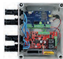
Solar Sentry 4G 2 stringes (2x500V)

A GSM modullal szerelt rendszer, eseményenként (5 féle) értesítést tud küldeni 8 felhasználó számára SMS és hangüzenet formájában. Contact ID üzenet küldése távfelügyelet részére hanghívás és GPRS formájában.